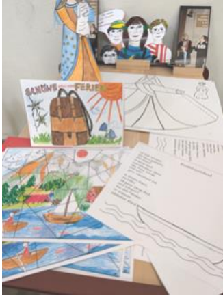
(liebvolle Gestaltung in der Ferienzeit von den Frauen Miebach)

Hier bei uns in NRW enden am 20. August 2024 die Schulferien und damit die Urlaubszeitfenster für Familien mit schulpflichtigen Kindern und für alle sonst an die Schulferien gebundenen Berufe.